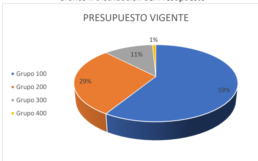
Grafico I. Distribución del Presupuesto